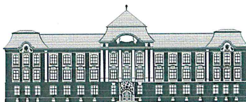
COLEGIUL NAȚIONAL "CONSTANTIN DIACONOVICI LOGA" PRIMUL LICEU CU PREDARE ÎN LIMBA ROMÂNĂ DIN CAPITALA BANATULUI

NR. 2186/2/19.07.2021 100 DE ANI DE ÎNVĂȚĂMÂNT ÎN LIMBA ROMÂNĂ