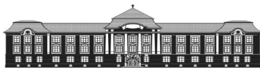
COLEGIUL NAȚIONAL "CONSTANTIN DIACONOVICI LOGA" PRIMUL LICEU CU PREDARE ÎN LIMBA ROMÂNĂ DIN CAPITALA BANATULUI

Nr.____/_____ Avizul unității școlare de unde pleacă elevul/eleva Avizat/ Neavizat DIRECTOR,